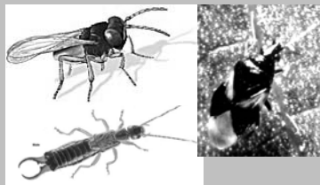
Trichogramma, Earwig at Flower Bug