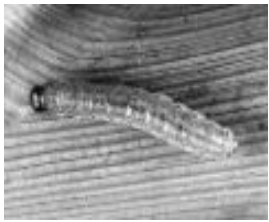
Ang Mapaminsalang Asian Corn Borer

Ang Asian Corn Borer (ACB) , Ostrinia furnacalis ay isa sa pinakamapaminsalang insekto sa maisan. Ang mga ito ay nagsisimulang maminsala apat (4) na linggo matapos makatanim hanggang sa makapag-ani. Ang pinakamapaminsalang yugto ng buhay ng corn borer ay kung ito ay nasa anyong uod. Maaring bumaba ang ani ng mais mula 20-80 %.